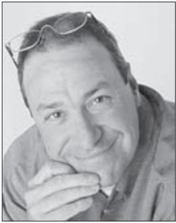
JOE NOCERA

It was Nov. 25, 1963, three days after the Kennedy assassination, and the powerful columnist was calling the neophyte president. Already, Joseph Alsop had penned a personal letter to Lyndon Johnson offering his support. The phone call was an attempt to offer something more: advice.